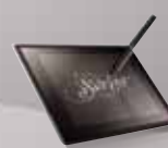
Avec Vista et Seven, le stylo fait fonction de souris et de tablette