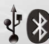
Connectez-vous en USB ou Bluetooth