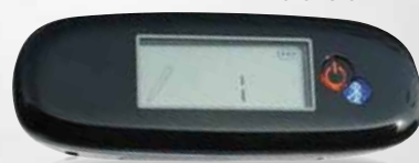
Stylo numérique à encre