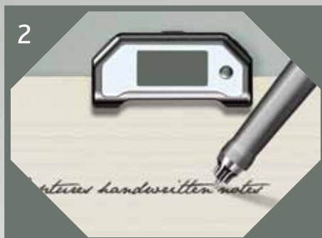
2 Prenez vos notes comme d'habitude, avec le stylo numérique à encre e-pens.