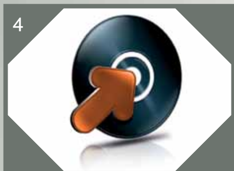
4 Enregistrez et sauvegardez vos notes et diagrammes.