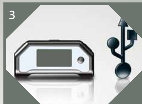
3 Connectez la base en USB et transférez vos notes dans le logiciel de gestion de notes.