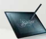
Avec Vista et Seven, le stylo fait fonction de souris et de tablette