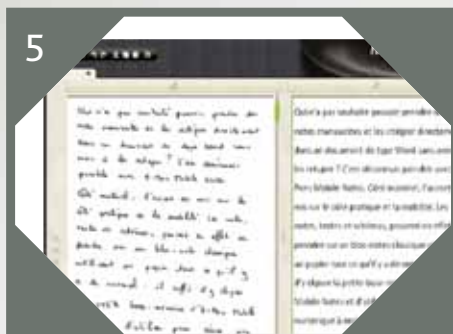
5 Convertissez vos notes en texte grâce au logiciel inclus.